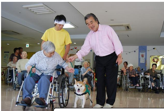
～沼津市内の老人保健施設「ヒルズかどいけ」訪問～