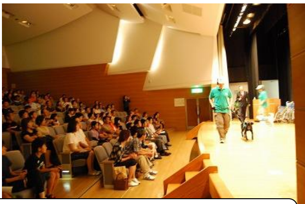
「セラピードッグの活躍と命の大切さ」講演会 会場は多くの聴衆でいっぱい～