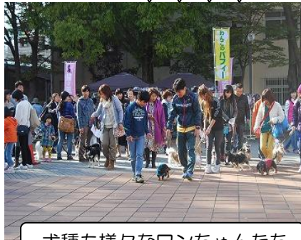
犬種も様々なワンちゃんたち