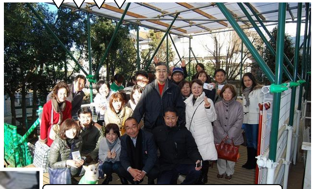
下は小学生から幅広い年齢層が参加