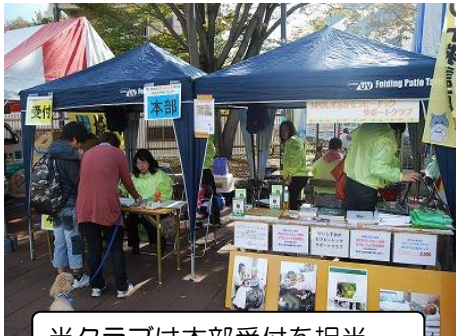
当クラブは本部受付を担当

初めての開催と言う事で何もかも手探りの状態でしたが、一日を通して何のケガもトラブルもなく、最後まで笑顔で無事に終える事ができました。人と犬との共生や動物愛護についても考えることができたイベントなので、今後も続くことを願っています。♡♡♡♡