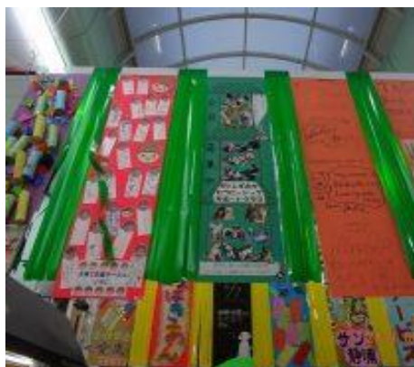
仲見世商店街に飾られたメガ短冊(左)

7月、沼津仲見世商店街、毎年恒例の七夕祭り。今年は「メガ短冊を飾ろう！」に参加しました。大きな短冊に思い思いの飾り付けをして仲見世に飾ります。当クラブはもちろん、動物愛護と命の大切さをアピールしました。作成は、6月の定例会の時に行いました。いつも募金でお世話になっている、PB倶楽部会長さんご夫妻もお手伝いに来てくださいました。皆でワイワイ、童心に返って楽しい作業タイムを過ごしました。