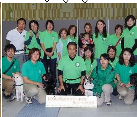
セラピードッグは大人気!