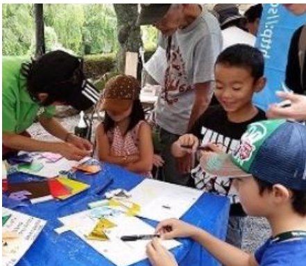
チビッ子と一緒に楽しんでいるメンバー

毎年、夏休み最後の日曜日は恒例となっている、三島大社の「だがしや楽校」に参加しました。4回目となる今年はワークショップ「折り紙で犬を作ろう」を提供しました。たくさんのチビッ子が、夢中で折り紙を折る姿はとても微笑ましかったです。メンバーは、子供たちに折り方を教えながら、動物愛護について、話をすることもできました。1匹1匹、全部名前をつけて、約180匹の個性豊かなワンちゃんが出来上がりました。参加してくれた子供たちは、小さな命を大切にする、心優しい大人になってくれることでしょう！