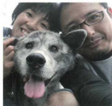
幸せいっぱいジローくん

それからはシローとの信頼関係を築くため、毎日御殿場に通り、シローや他の残された犬のお世話をしました。シローはそれはそれは穏やかな良いコでした。初夏に迎え入れたシローでしたがその後、口の中に骨肉腫が見つかり肺への転移もあり、余命数日と言われ、そこからは癌との戦い！シローと主人と私、病気に向かい合って更に家族の繋がりが強くなりました。お家点滴したり介護や看病、悲しまないで楽しくやり遂げました。シローは本当強いコだった。病院でも先生方や看護師さんに可愛がられ、おじいさん犬シローはとても人気者(*^^*) 冬がきてクリスマスイブの朝、シロー虹の橋を渡りました。私達と過ごしたのは半年間。短かったけど、私思うんです。どう生きたかということの方が、期間よりも大切なんじゃないかって。シローと出逢って人生ますます豊かになりましたもん！病気は嫌だけど、憎いものでもなかった。病気によって更に家族の絆が強まったし。私達、またワンコと暮らしたいと思ってます。殺処分にあるコ、大きいというだけでハンディになってしまうワンコを迎えたいです。そしてこれからもシローの愛を感じながら、動物愛護に携わっていきたいです。