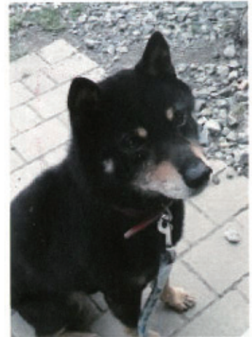
脱走王 クロちゃん

今回は、すぐに保健所に連絡…すると「お宅の犬預かっていますよ。間違いないと思います。」とのこと。案の定クロでした…私が絶対に迎えにきてくれるだろうと学習したのかしっぽを振って待っていたので、その姿に少しムカッとしました。家に帰って今回ばかりは鬼のような顔で叱ったの言うまでもありません…。『手のかかるワンコほどかわいい』は人間だけではないと痛感しました。脱走王クロとの戦いは今後も続くでしょう(笑) 飼い犬には、必ず迷子札、鑑札をつけましょう!!